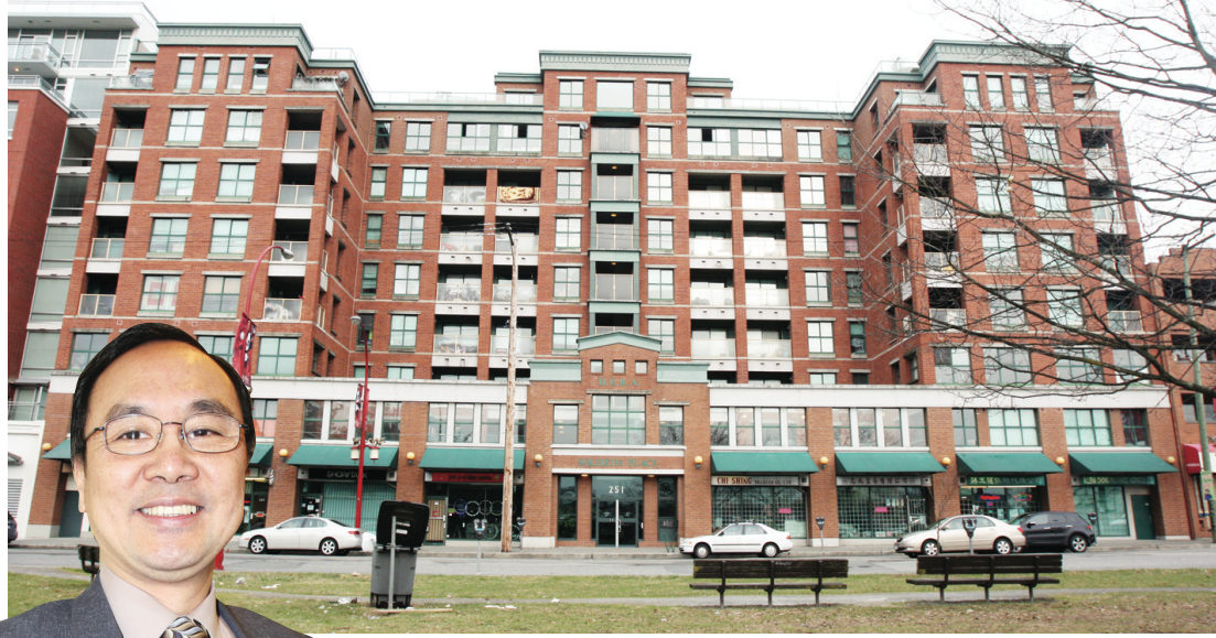
▲中僑接管的Solheim Place是華埠內最大的社會房屋計劃。 ▲譚卓全說2011年對中僑來說是關鍵性的一年。

中僑還未知道管理合約有多少年。林偉樵估計最少5年，但雷恩伯符透露，合約將會一直有效到2028年9月30日。