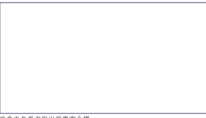
晚會中各長者與出席嘉賓合照。

職業輔導組亦提供免費國粵語個人就業輔導服務，內容包括就業培訓推薦、英語進修途徑、市場需求情況等。請在辦公時間致電六零四