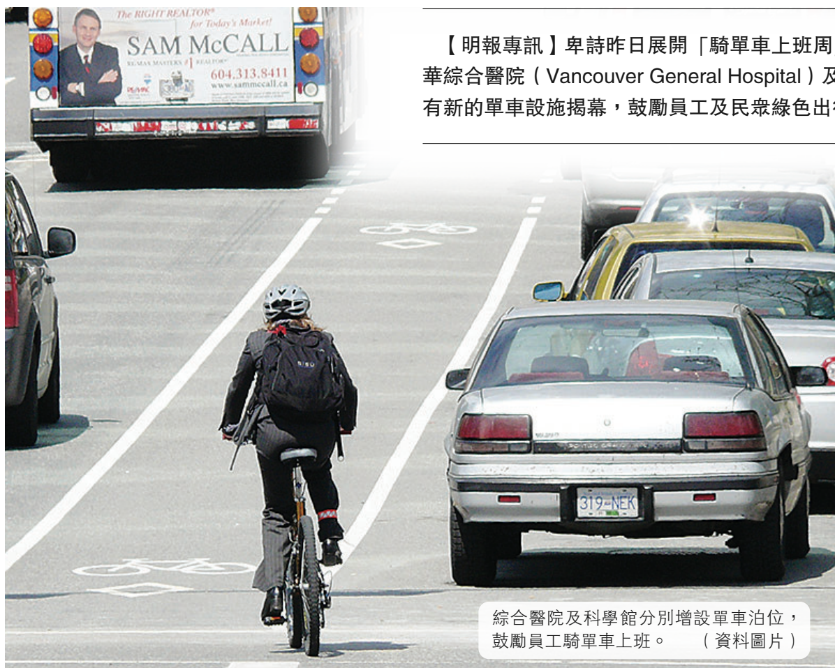
綜合醫院及科學館分別增設單車泊位，鼓勵員工騎單車上班。(資料圖片)

【明報專訊】卑詩昨日展開「騎單車上班周」(Bike To Work Week)活動，溫哥華綜合醫院(Vancouver General Hospital)及溫哥華科學館(Science World)分別有新的單車設施揭幕，鼓勵員工及民衆綠色出行，既省錢又保護環境。