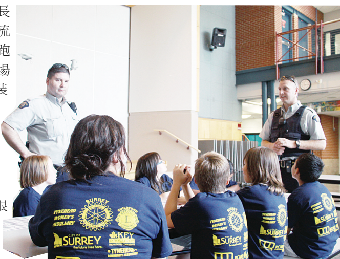
今年素里的「少年警校」名額已滿，有興趣的素里居民明年可向該市公園局(Surrey Park & Recreation Department)報名。