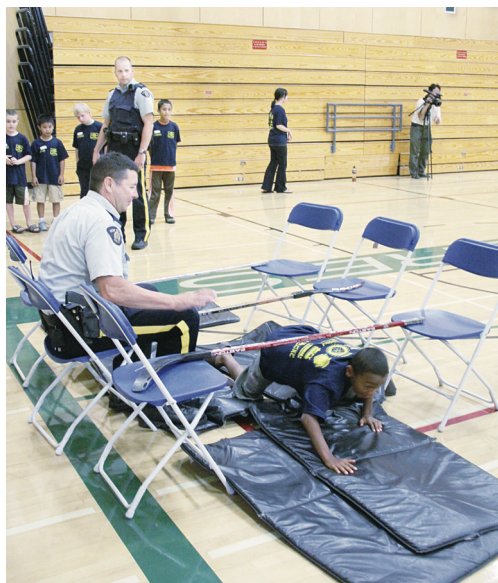
▲「學員」們在騎警的帶領下進行障礙賽跑。 ▲騎警向「學員」們講解蒐集指紋的方法。