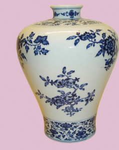
清 乾隆 官窑 青花三多梅瓶 高: 33cm