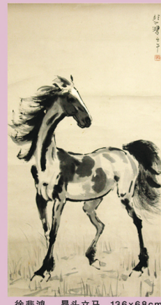
徐悲鴻 馬頭立馬 136x68cm