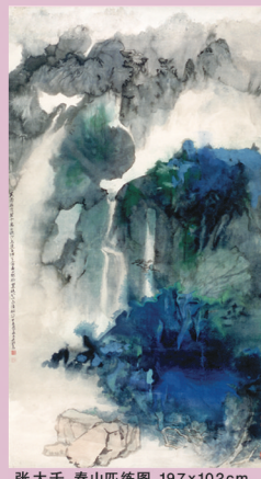
張大千 春山匹練圖 197x102cm