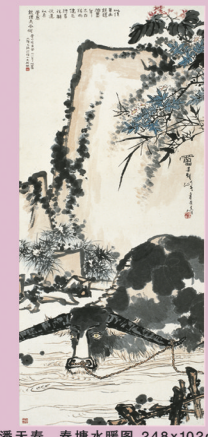
潘天壽 春塘水暖圖 248x102cm