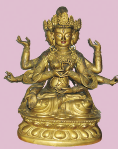
清 乾隆 造办处 鑲金四面佛 高: 55cm