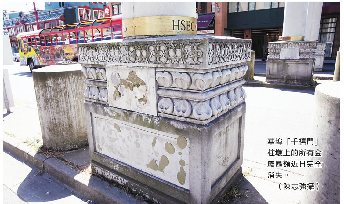
華埠「千禧門」柱墩上的所有金屬匾額近日完全消失。