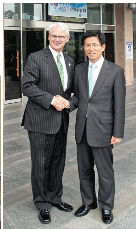
金寶爾（左）與京畿道省督Moon-Soo Kim（右）簽署姊妹省分條約。

與香港特區行政長官曾蔭權會面。蘇利文本周三（香港時間）將於香港總商會及加拿大總商會的會議