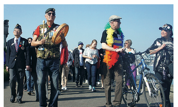
昨日近百名市民參與權利與自由遊行。

Prices are subject to change and to applicable taxes. Pictures, drawings and digital renderings are for illustrative purposes only and should not be relied upon. E&OE. Sales and Marketing by Intracorp Realty Ltd. Intracorp C35 Limited Partnership.