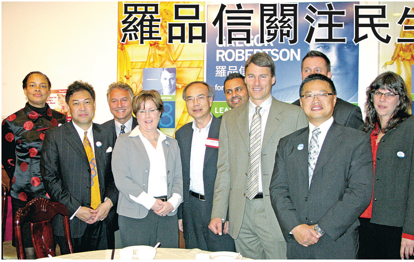
偉景溫哥華 (Vision Vancouver) 昨日於華埠舉行午餐聚會，邀請數十名華裔社區僑領及中文傳媒代表，就市選及市政議題進行交流。

【明報專訊】偉景溫哥華 (Vision Vancouver) 昨日於華埠舉行午餐聚會，邀請數十名華裔社區僑領及中文傳媒代表，就市選及市政議題進行交流。