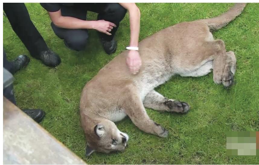
維多利亞市區近日美洲獅出沒頻繁，圖為上週闖入市區的一頭美洲獅被用麻醉槍制伏。（Global電視畫面）

由於美洲獅頻繁出現，且未能確定其具體位置將其制伏，維市警方提醒市民，盡量讓寵物和孩童留在屋內，建議家長陪伴子女上學。