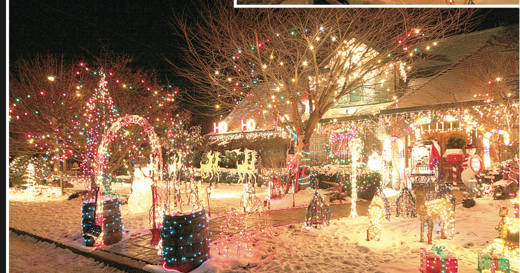
伍德曼 (Woodman) 家庭用了1萬個燈泡裝飾他們位於列治文 Garry 街的「HoHoHo House」。小圖：溫東 Trinity 街超過100間房屋每年也會亮起聖誕燈飾籌款。

● 3751 Tinmore Pl.：連續第32年布置聖誕燈飾的瓊斯 (Jones) 家庭，今年為兒童醫院收集捐款，燈飾由晚上6時至10時開放。