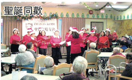
聖誕同歡 聖保祿校友今年已是第十年在聖誕節期間到訪安老院。該校校友們日前前往天恩、李國賢及華宮安老院，頌唱聖誕歌，派送禮物給長者，更與眾人齊玩遊戲，讓他們感受到社會的關懷，度過一個快樂的聖誕節。