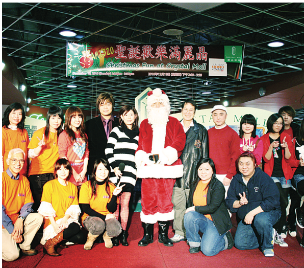
由威哥扮演的聖誕老人和工作人員合照。