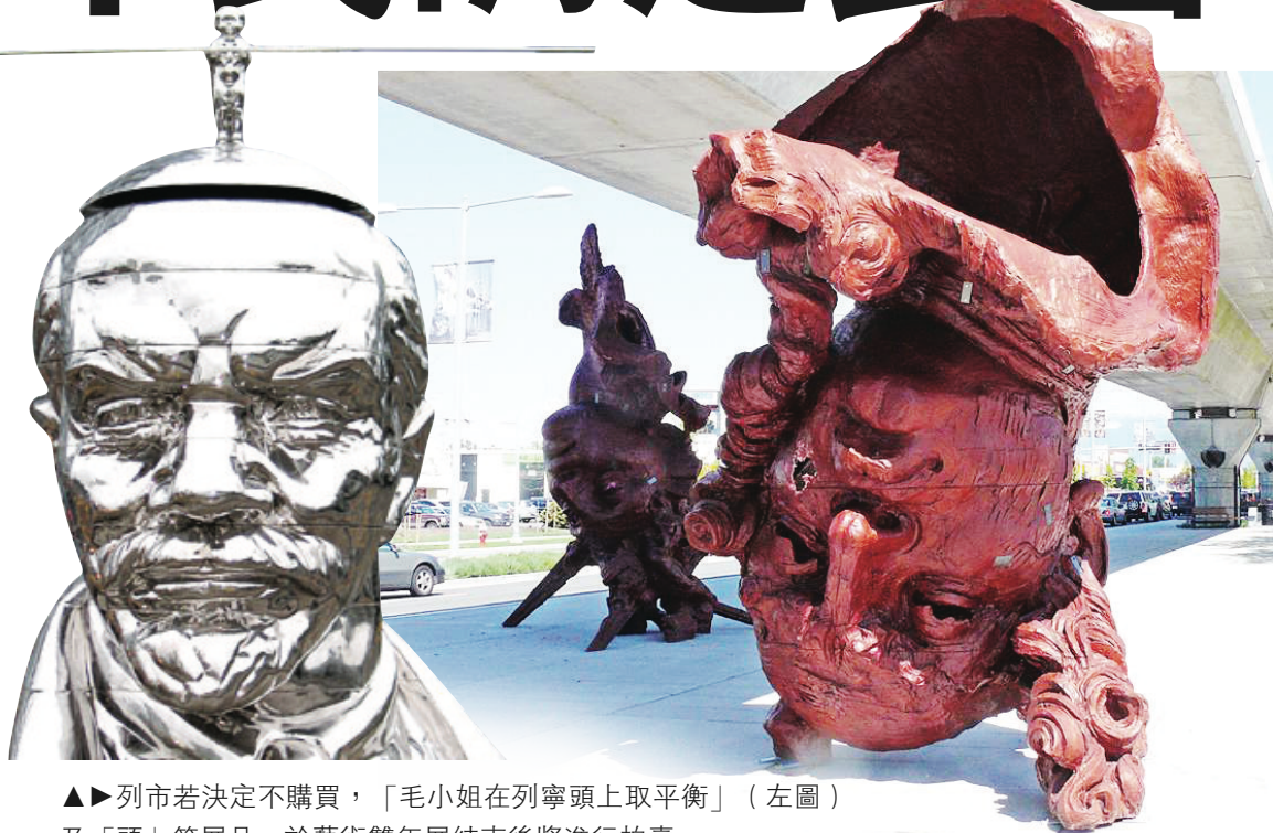
▲▶列市若決定不購買，「毛小姐在列寧頭上取平衡」（左圖）及「頭」等展品，於藝術雙年展結束後將進行拍賣。

「毛小姐」和「Water #10」出自中國藝術家之手，「知識之門」由英國藝術家創作，「風浪」和「頭」均是墨西哥作品，其中放置在蘭士登空車站下的3個「頭」曾於今年5月遭蓄意破壞，被硬物擊穿「破相」，甚至被當作「垃圾桶」拋棄垃圾及潛入內小便等。