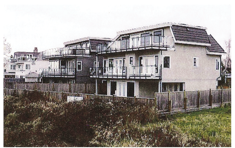
列治文市政府，對三層高平頂住宅房屋的結構，進行檢討研究。