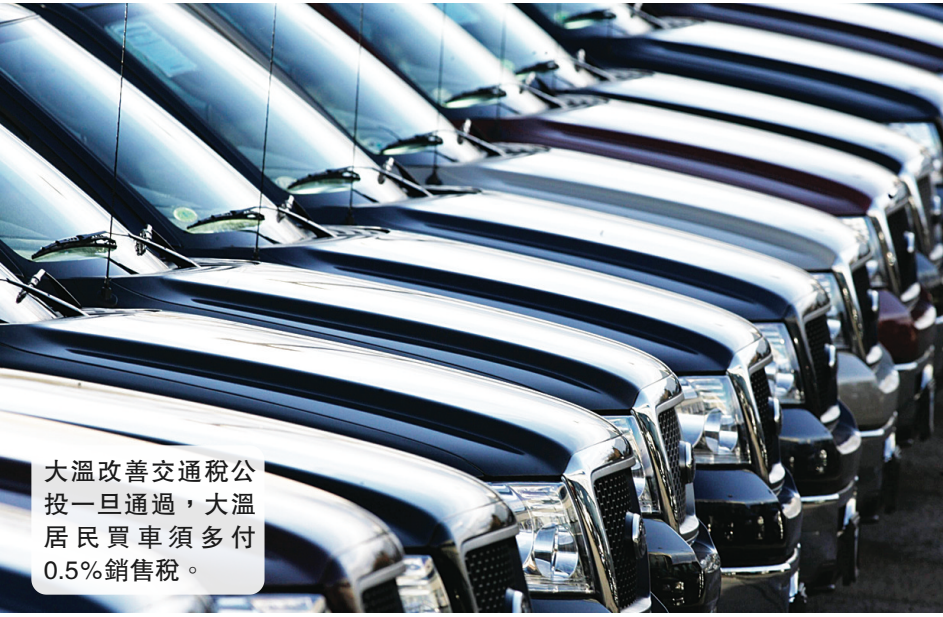
大溫改善交通稅公投一旦通過，大溫居民買車須多付0.5%銷售稅。

【明報專訊】大溫改善交通稅公投一旦通過，大溫居民就算在大溫地區以外買車，仍須支付新增的銷售稅0.5%，因為徵稅針對車主登記的地址，而非買車地點。