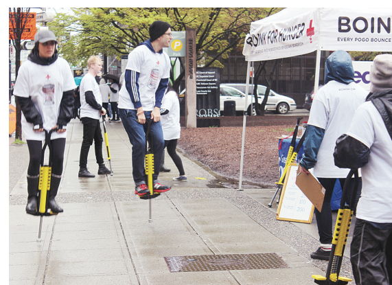
「快樂彈跳日」為食物賑濟庫募款。

昨日氣候欠佳，但「彈跳日」的義工們一個個活蹦亂跳，玩着彈簧單高蹺，吸引路人注意。一名義工說，玩彈簧單高蹺需要練習讓身體平衡，一旦上手可以不費力氣的一直跳着，前兩年一名小學生即跳了6,733次，是活動舉行以來的最高彈跳紀錄。