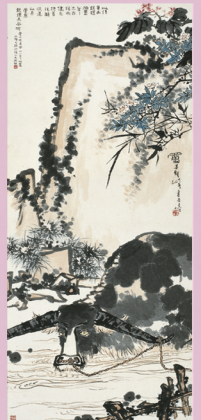
潘天壽 春塘水暖圖 248x102cm