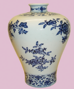
清 乾隆 官窑 青花三多梅瓶 高：33cm

活動地點：溫哥華 Sheraton Hotel (一樓) 7551 Westminster Highway, Richmond, BC V6X 1A3