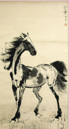
徐悲鴻 馬頭立馬 136x68cm