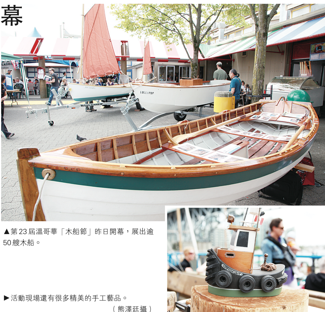
▲第23屆溫哥華「木船節」昨日開幕，展出逾50艘木船。

木船節將於今明後3日繼續在格蘭護島進行，詳情請瀏覽www.vancouverwoodenboat.com。