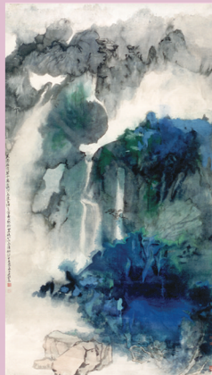
張大千 春山匹練圖 197x102cm