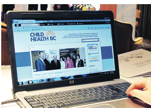
病童及他們的家人可從網站下載新資料冊或獲取有關糖尿病的最新信息。