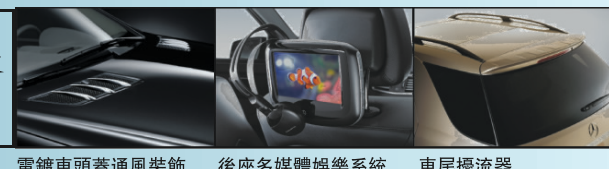
鍍鉻車頭蓋通風裝飾 後座多媒體娛樂系統 車尾擾流器

平治汽車「家家有平治」優惠計劃為閣下提供駕駛2011年款B系AVANTGARDE EDITION, C, ML系AVANTGARDE EDITION和GLK系最好時機，除首三月免供款/月租外，選購及安裝各項原裝平治後加配備更有25%折扣，B系及ML系各款前衛型號更為閣下提供分別超過$900及$3000免費配置，一個前所未有的優惠計劃，為免向隅，請即到大溫各平治陳列室試車選購。