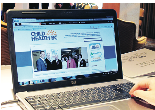
病童及他們的家人可從網站下載新資料冊或獲取有關糖尿病的最新信息。