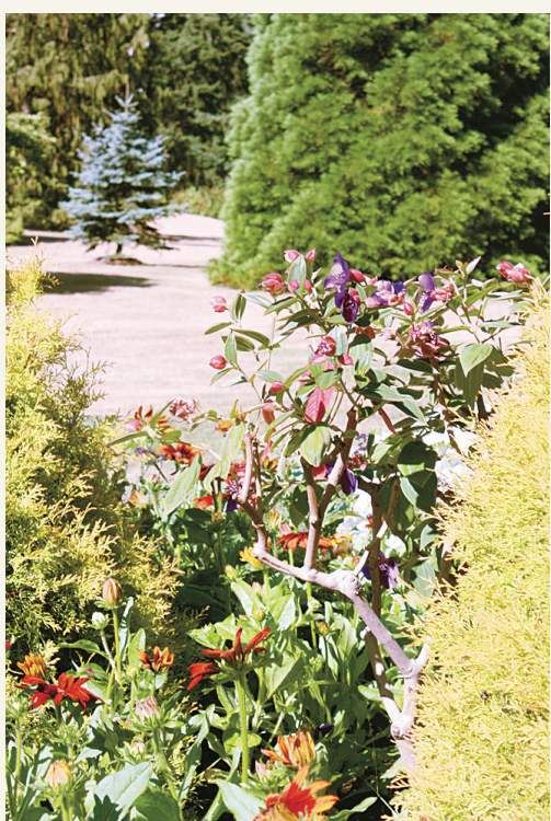
溫哥華的女王公園，於夏天百花盛放，吸引不少遊客。(網上圖片)

旅遊業是卑詩省最具持續性產業，在2009年為本省製造了127億元的收入，為12.9萬人提供了就業機會。麥雅雯表示，這個月的國際遊客增長趨勢會為卑詩省帶來更多就業機會，而與中國簽訂指定旅遊目的地協議，將為卑詩旅遊業帶來不可估量的發展前景。