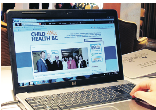
病童及他們的家人可從網站下載新資料冊或獲取有關糖尿病的最新信息。