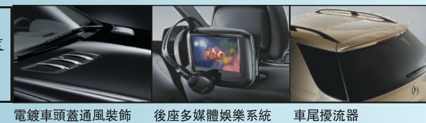
鍍鉻車頭蓋通風裝飾 後座多媒體娛樂系統 車尾擾流器

平治汽車「家家有平治」優惠計劃為閣下提供駕駛2011年款B系AVANTGARDE EDITION, C, ML系AVANTGARDE EDITION和GLK系最好時機，除首三月免供款/月租外，選購及安裝各項原裝平治後加配備更有25%折扣，B系及ML系各款前衛型號更為閣下提供分別超過$900及$3000免費配置，一個前所未有的優惠計劃，為免向隅，請即到大溫各平治陳列室試車選購。