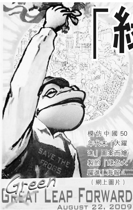
模仿中國50年代末「大躍進」圖案而繪製的「綠色大躍進」海報。