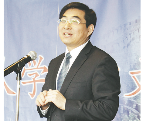
▲中領館於長學領事致辭。 ▲獲獎者與其他參賽者及嘉賓大合照。