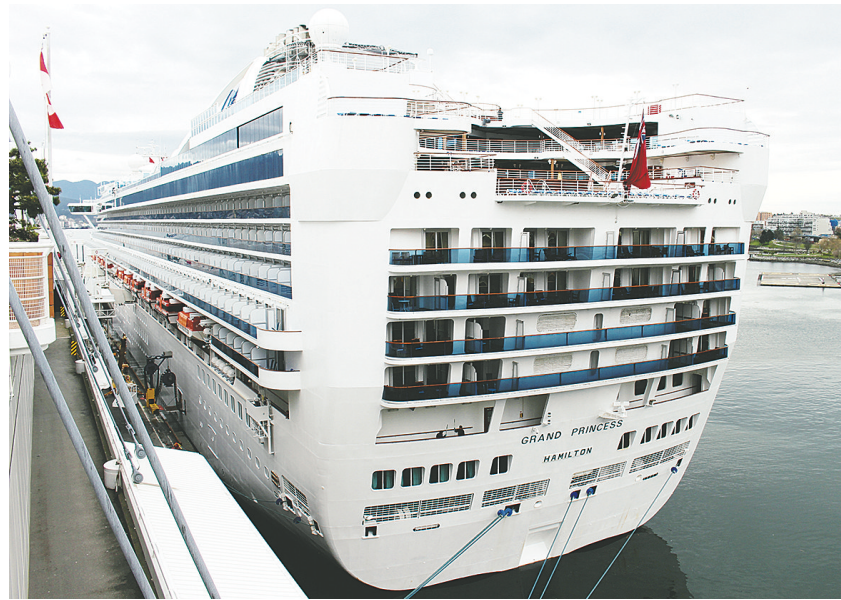
「至尊公主」號抵達溫市，令本地郵輪季節提早展開。

【明報專訊】溫哥華昨日迎來今年首艘大型郵輪停靠，該郵輪稍後會啟程前往夏威夷群島(Hawaiian Islands)，這亦是溫哥華與夏威夷群島來回航線首次加入常規服務，由此也令今年溫市的郵輪季節提早展開，且會一直持續至12月。 今年第一艘停泊溫哥華的郵輪是公主郵輪公司(Princess Cruise)旗下的「至尊公主」(Grand Princess)號，大溫港口局的奧爾特加(Carmen Ortega)表示，每年4月到9月的溫哥華到阿拉斯加郵輪航線世界知名，現在公主郵輪公司新闢溫哥華到夏威