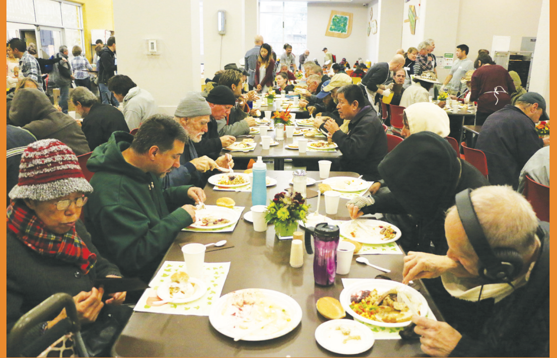
▲用餐大廳內部秩序井然，人們正在享用火雞大餐。