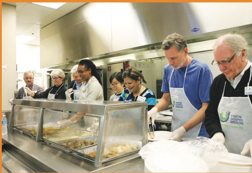
大量義工為此次感恩節午餐提供服務。