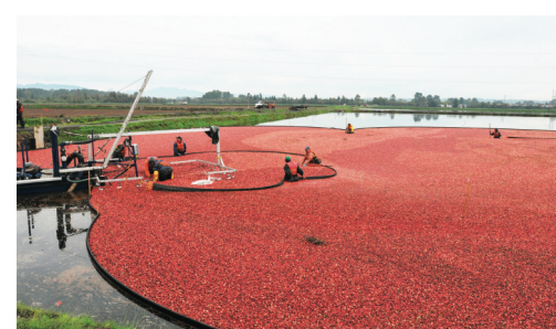
蔓越莓收割場面非常壯觀。(資料圖片)

奇化還表示，除了一些新鮮銷售的蔓越莓外，大多數收割的蔓越莓要等到聖誕節才會上市銷售。