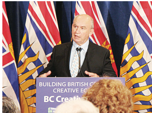
貝耐德公布，政府推行針對創作工業的政策。

動，為全省的「愛兒行動」(Campaign for BC Children)的一部分；「愛兒行動」的籌款總目標為2億元，目的是興建卑詩省兒童醫院新院舍，目前已籌得善款1.58億元，距離善款目標還有4,200萬元。