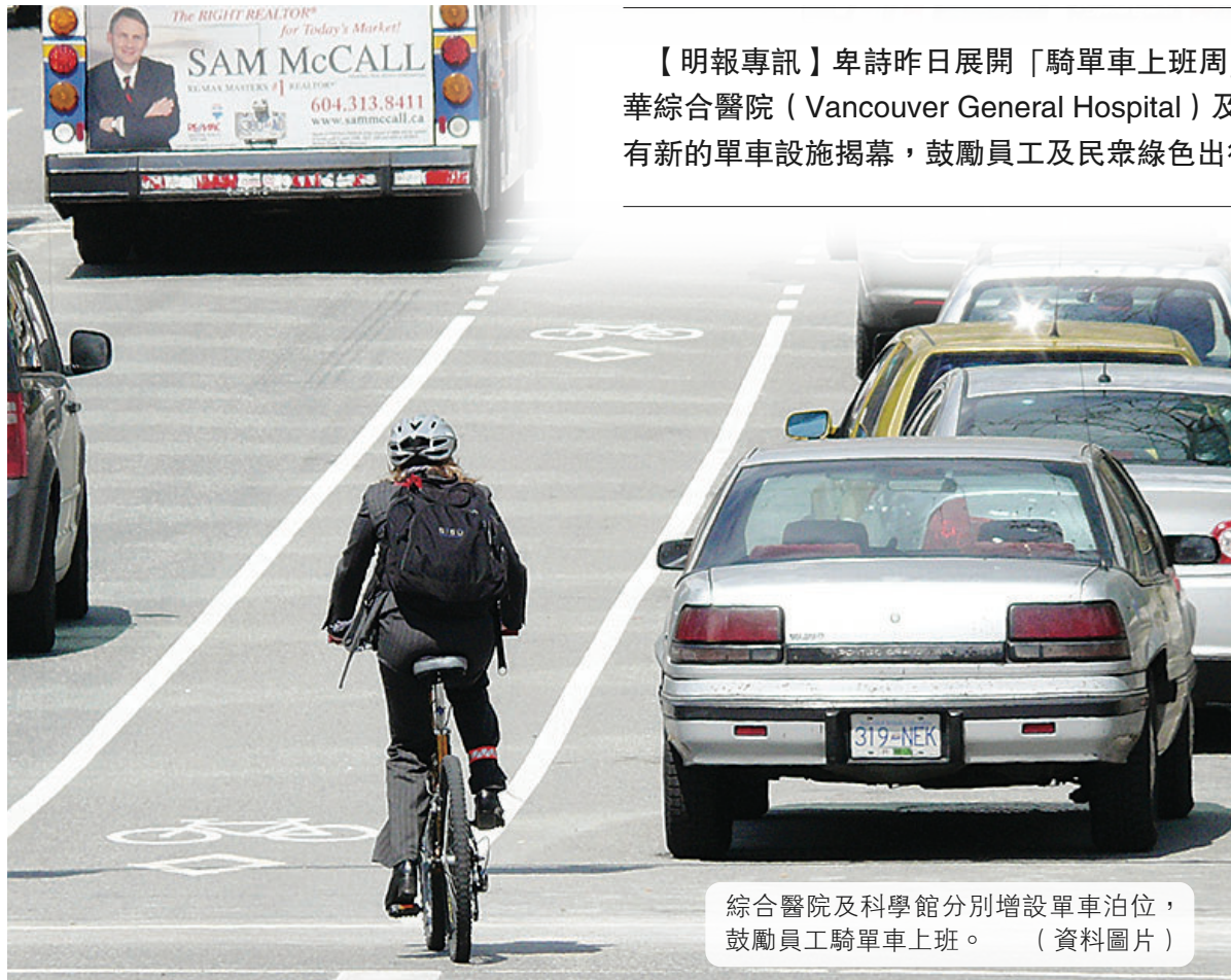
綜合醫院及科學館分別增設單車泊位，鼓勵員工騎單車上班。(資料圖片)

【明報專訊】卑詩昨日展開「騎單車上班周」(Bike To Work Week)活動，溫哥華綜合醫院(Vancouver General Hospital)及溫哥華科學館(Science World)分別有新的單車設施揭幕，鼓勵員工及民衆綠色出行，既省錢又保護環境。