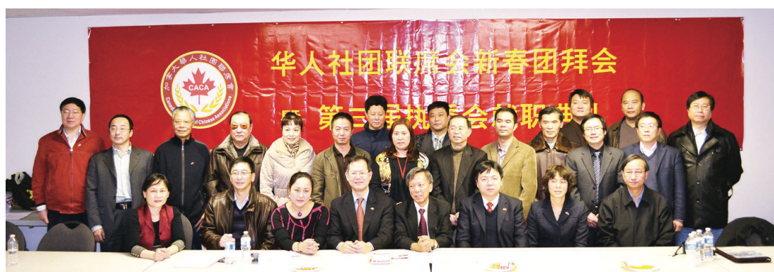
華人社團聯席會新年團拜合照。