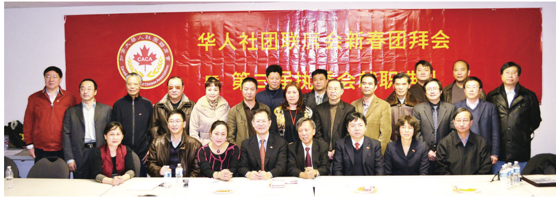
華人社團聯席會新年團拜合照。