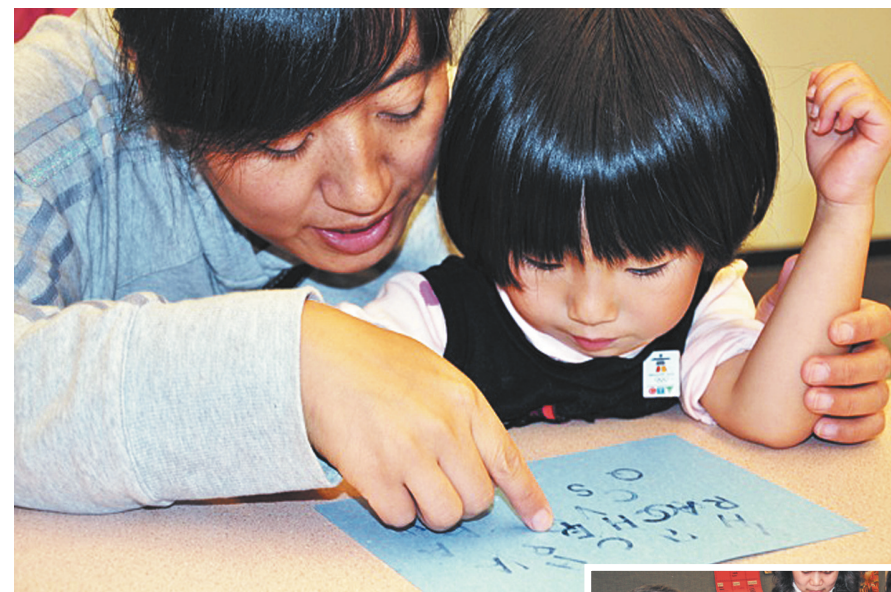
參加 PALS 課程的家長和孩子。

【明報專訊】家中有學齡前兒童的新移民家庭，不妨嘗試由省教育廳和2010年冬奧Legacies Now非牟利組織共同撥款設立的「移民父母作為讀寫支援者」(Immigrant Parents as Literacy Supporters, 簡稱PALS)免費課程，家長可以學習如何幫助年幼的子女，養成閱讀習慣和兒童早期發展的知識，多名參加課程的家長表示受益良多。