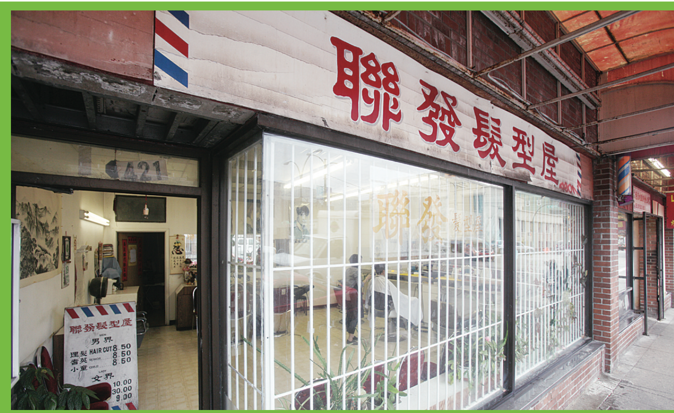
▲▲聯發(上)及麗新(右)兩家傳統髮型屋還未找到新舖址。