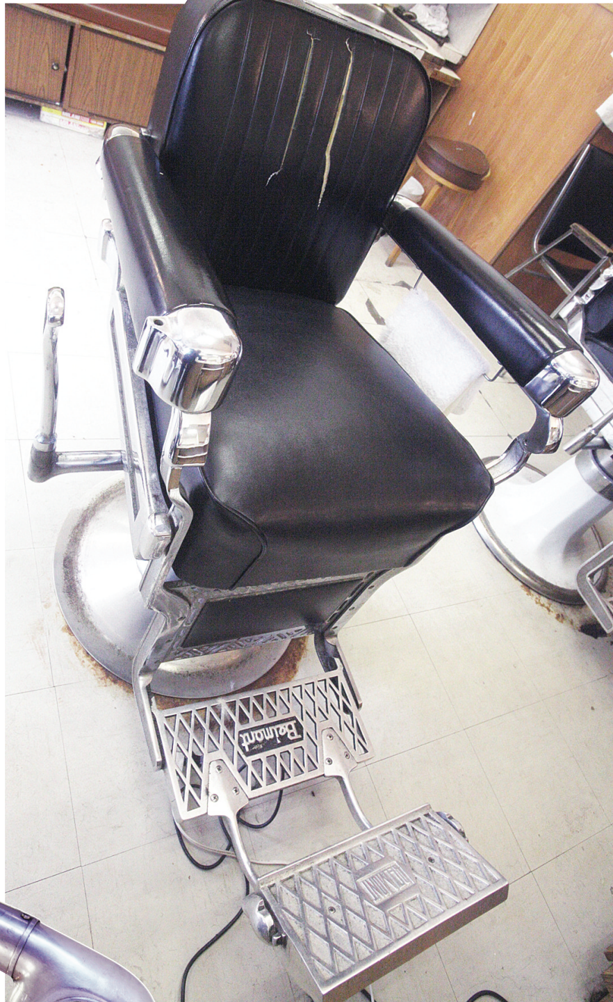
▲數十年如一日照常運作的傳統理髮椅。 ▲「麗新」仍然保存金屬殼吹風筒。 ▼磨刀皮也有考究。