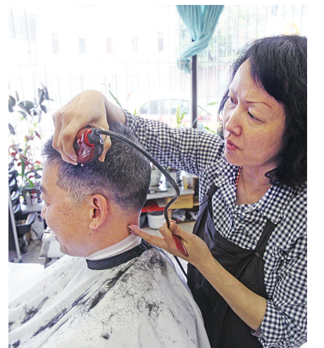
傳統理髮手藝能否傳承下去？