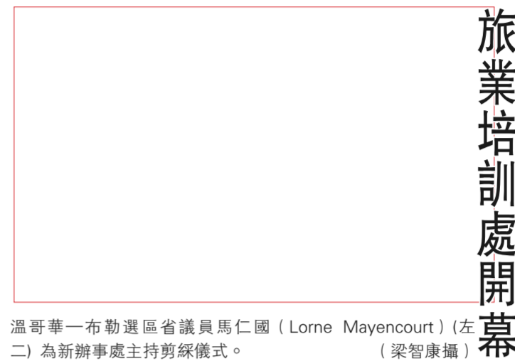
溫哥華一布勒選區省議員馬仁國（Lorne Mayencourt）（左二）為新辦事處主持剪綵儀式。

恭賀新禧！希望新的一年帶來新機會。然而，機緣是否巧合，卻視乎自己是否有準備。有能力而未遇上發揮的機會，正所謂「懷才不遇」，自然十分令人惋惜。 倘若機會來了，卻沒能力抓住，那就是「坐失良機」！ 瞬息萬變的電腦高科技，在各行各業之中，孕育着各種各樣的機會。二十多年前，半導體數碼技術的成熟給了IBM製造第一台個人電腦的機會，而當年IBM所採取的Open Architecture的開放策略，卻拱手為千萬廠家送上了生產兼容容器的機會。電腦售價得以下調，迅速廣泛普及，又為應用軟件發展商大大擴充商機。 如今，電腦生產競爭白熱化，電腦製造業業績下降。但另一方面，隨着社會、企業、家庭，乃至個人對電腦應用的依賴日益加深，人們經不起電腦故障、軟件損失、黑客入侵與病毒感染所帶來的困擾。這樣，自然迫使電腦用戶尋求保障、追求效率、講求效能。正如我們每一個人都注重身體健康、關注醫療服務質素一樣。豐衣足食之餘，生兒育女卻少了，只希望在世的長命百歲！ 誰來關注自己電腦的「健康」？以往，是去拍拍多少懂得電腦的親友的膊頭。但是，到了你不能等，親友也不會修的地步，機會