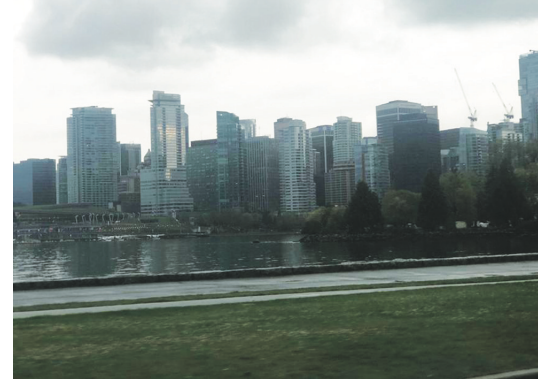
大溫昨日已見烏雲，今日料降大雨，降雨量可高達70毫米。

重現繁榮。 據介紹，舞火龍相傳起源於約140年前的香港，一個小村莊遭颶風、蟒蛇和瘟疫侵襲。村中有長者獲佛陀報夢，於中秋佳節舞火龍繞村遊行可驅疫消災，果然奏效，這個儀式自此流傳至今。