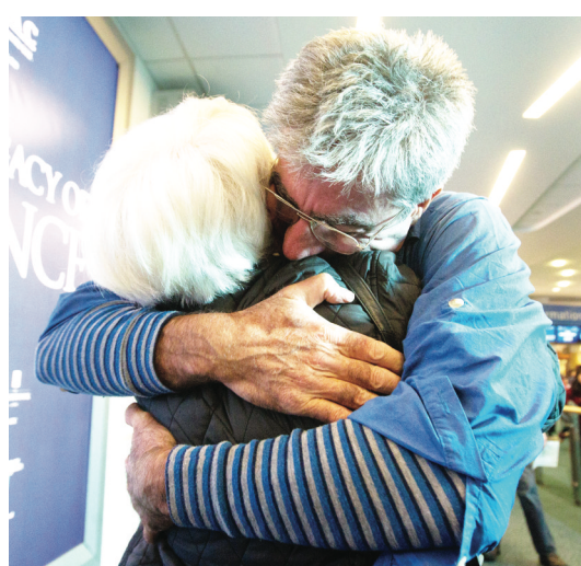
▲貝利沃在機場與迎接他的妻子緊緊相擁。 ▲貝利沃與妻子手舞足蹈，雀躍不已。