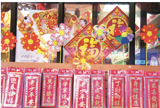
利市封、大福字、吉祥標語照例是春節前的大熱商品。