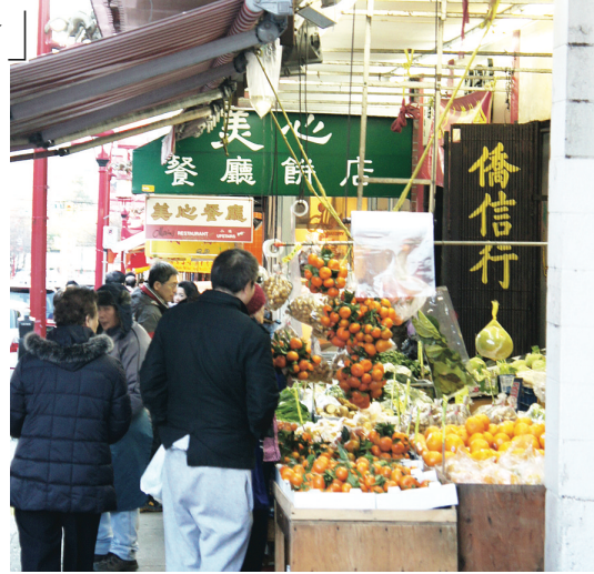
華埠各商家都將橘子等寓意吉祥的貨品擺在最顯眼處。