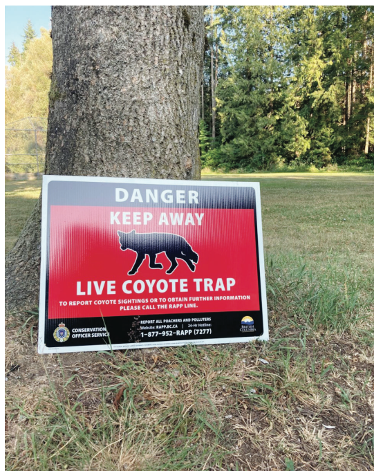
卑詩保育官員服務處已對史丹利公園內4隻曾襲擊過人類的成年郊狼實施安樂死。