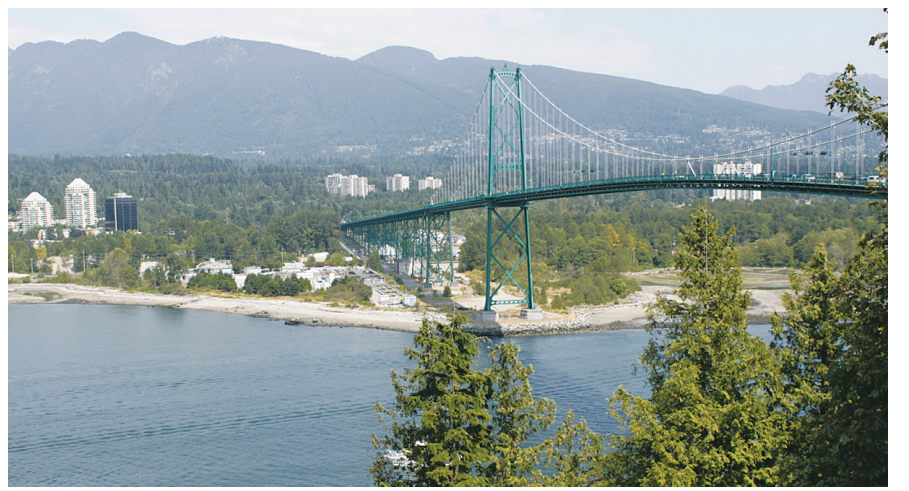
溫市及公園局皆表示無計劃關閉獅門橋。

【明報專訊】溫市政府和公園局澄清日前被曝光獅門橋（Lions Gate Bridge）秘密協議，稱溫市長和公園局主席都不贊同關閉獅門橋，沒有任何要關閉大橋的計劃。根據協議內容獅門橋將於2030年禁止私家車通行。