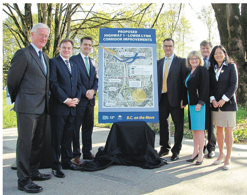
三級政府的代表出席昨日的活動，包括聯邦工業部長莫而進（右四）、省運輸廳長斯頓（左三）及北溫區市長沃爾頓（左一）。

另外，昨日有關注早前漏油事故，身穿化學防護衣的示威者到場示威，並向莫而進展示染上油污的石頭及木塊，要求禁止卑詩沿岸的運油輪增加。