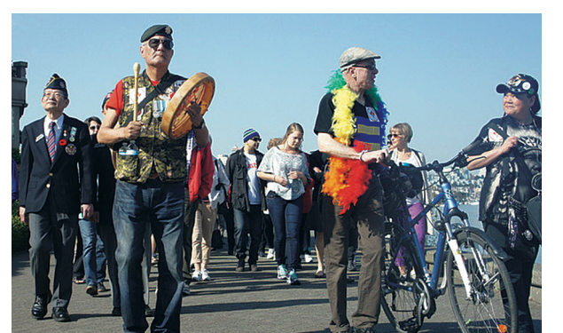
昨日近百名市民參與權利與自由遊行。

Prices are subject to change and to applicable taxes. Pictures, drawings and digital renderings are for illustrative purposes only and should not be relied upon. E&OE. Sales and Marketing by Intracorp Realty Ltd. Intracorp C35 Limited Partnership.