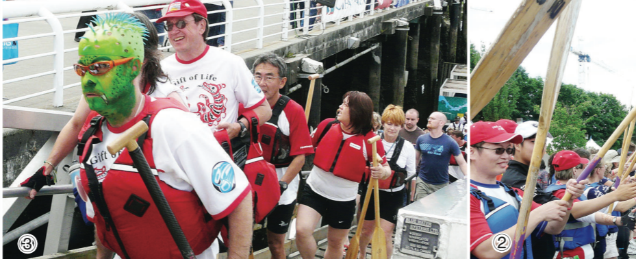
①一年一度的加鋁龍舟比賽已成為溫市每年的重要嘉年華活動，經過2日的比賽，昨日決出冠亞軍。圖為比賽選手昨日在福溪奮力衝刺。 ②者英隊比賽完畢上岸時，受到各參賽健兒舉樂歡迎。 ③參賽健兒的趣怪化妝。