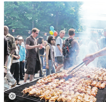
①本地多名政要出席「希臘日」慶祝活動，前排左起：金寶爾、蘇利文、歐博理、梅麗喬、羅品信。 ②③「希臘日」慶祝活動綿延幾條街道，全天數萬人蜂擁而至，最引人眼球的是希臘美女和武士，最讓人流連的則是烤肉攤。

因今年也是卑詩省加入加拿大聯邦150周年紀念，省長金寶爾由主辦單位安排，在兩位希臘美女陪同下，切蛋糕提前慶祝。