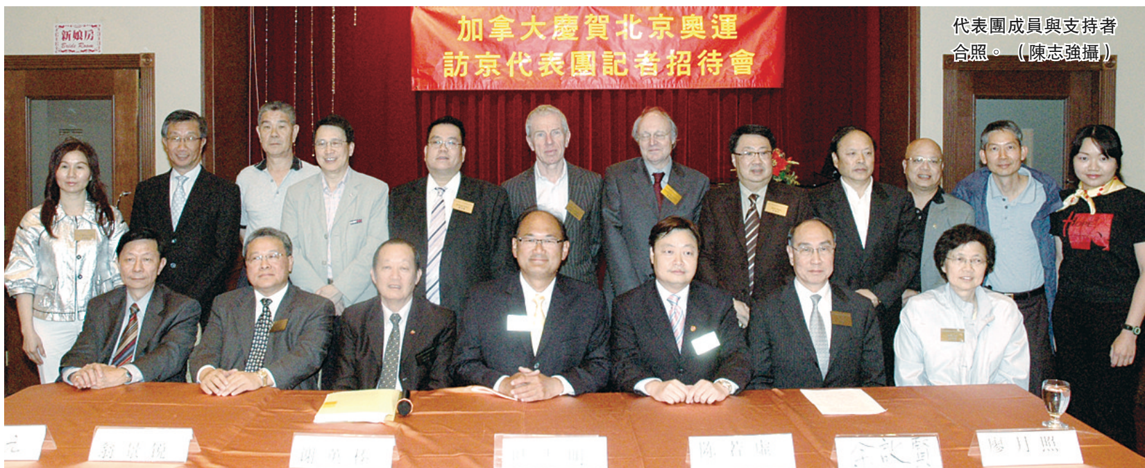
代表團成員與支持者合照。

【明報專訊】由加拿大華僑華人共建北京奧運場館委員會主辦的慶賀北京奧運會訪問團，將率領一個20人代表團前往北京參觀奧運開幕式，並趁機順道尋求商機。