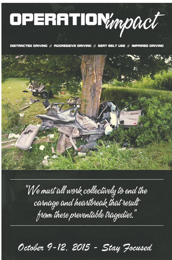
多地警方參與全國 Operation Impact 嚴打行動，望公眾渡過一個平安的長周末。