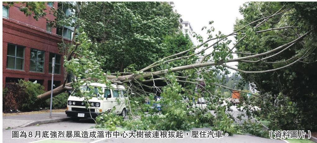
圖為8月底強烈暴風造成溫市中心大樹被連根拔起，壓住汽車。(資料圖片)

民眾可到 www2.gov.bc.ca/gov/content/safety/emergency-preparedness-response-recovery/preparedbc/know-the-risks/floods ，網頁右旁有中文資料下載的連結。