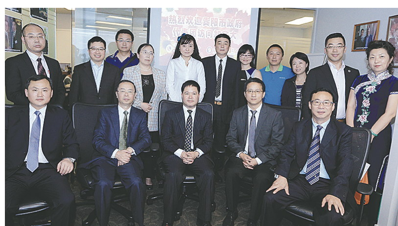
貴陽市政府代表團到訪溫市，在座談會後合照。