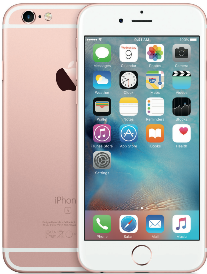
Apple iPhone 6 (S)