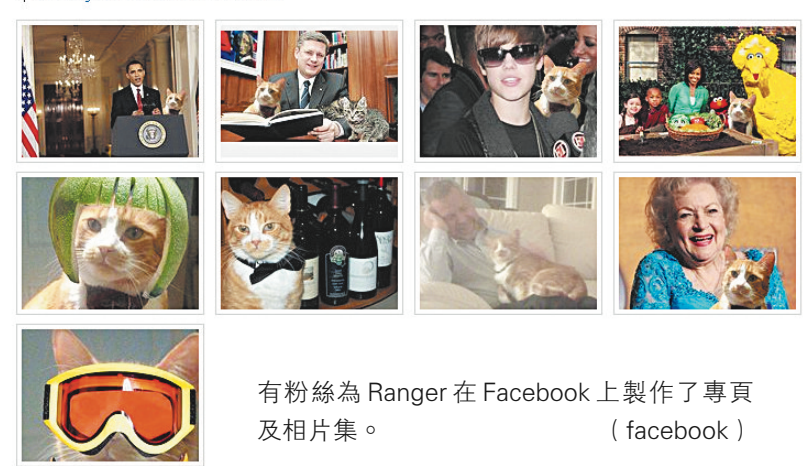
有粉絲為 Ranger 在 Facebook 上製作了專頁及相片集。（facebook）

百里為了支持節能而在家中點蠟燭與妻子共享燭光晚餐，Ranger 一不小心與蠟燭擦身而過卻