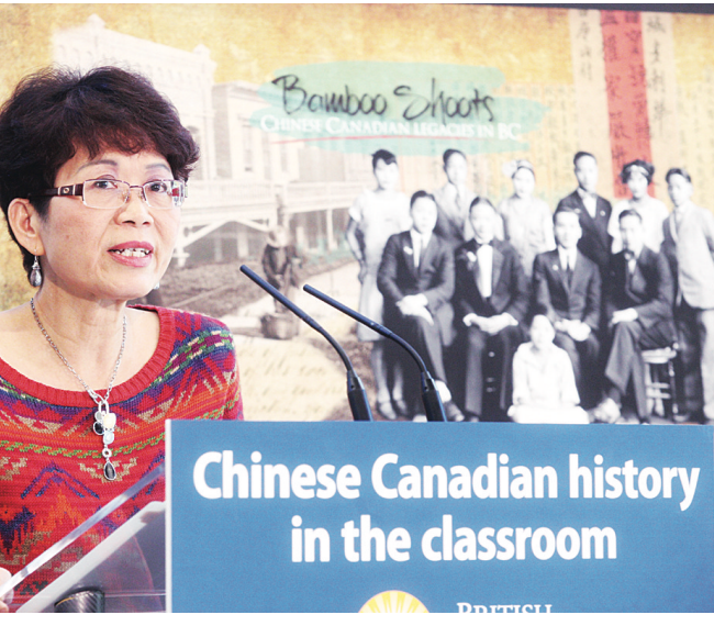
Chinese Canadian history in the classroom

比如是哀嘆詩句，博物館仿造成一塊從牆上擊下來的灰板，灰板上的中文詩句筆迹，刻畫痕迹，與原件幾乎一模一樣。人頭稅稅單也像實物一樣，稅單的底面都有原來的印刷與手寫字跡。甚