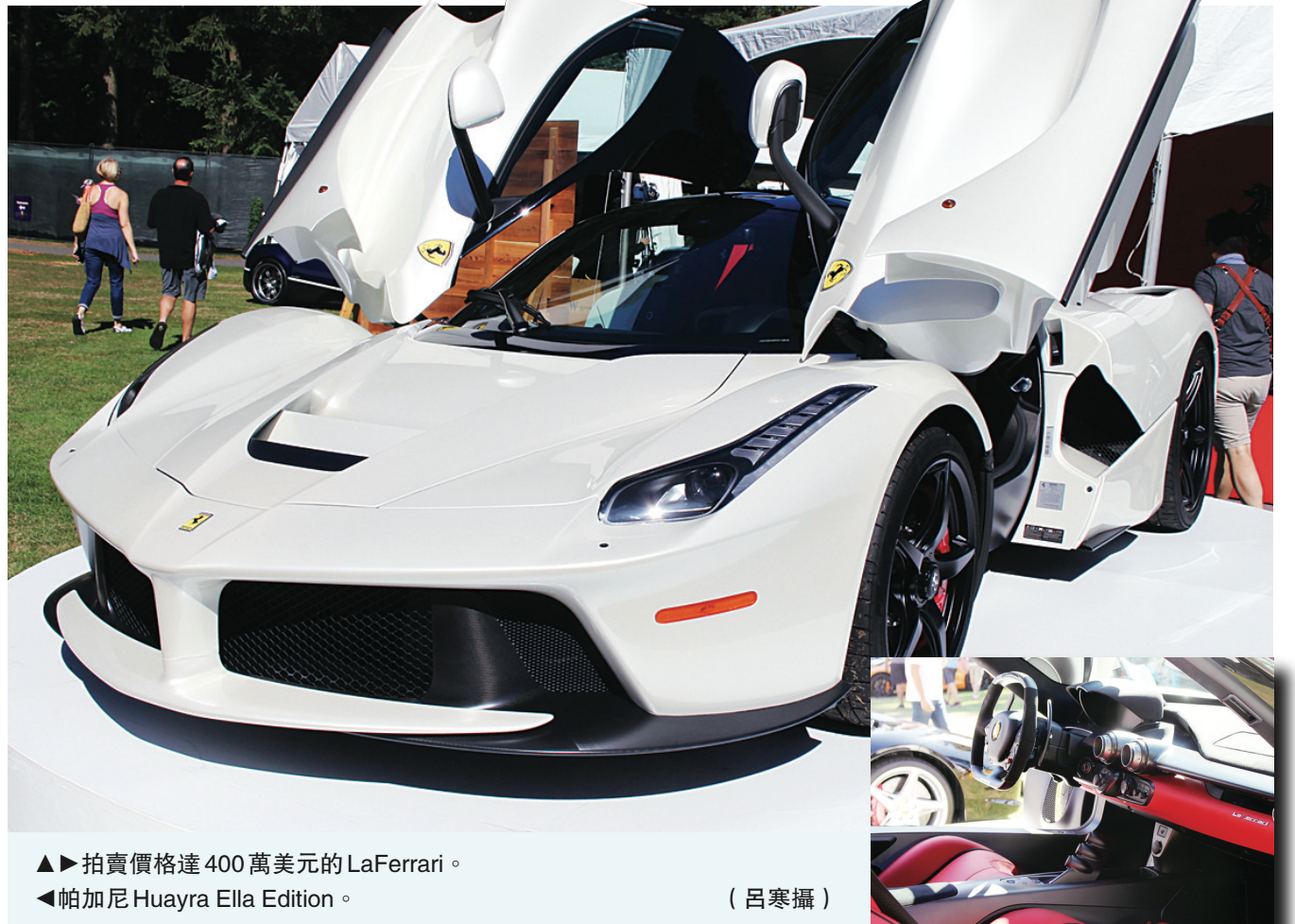
▲▶ 拍賣價格達 400 萬美元的 LaFerrari。 ◀ 帕加尼 Huayra Ella Edition。