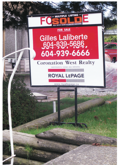
卑詩上個樓房交易近 9000 宗, 較去年同期升 2 成。(資料圖片)

數。」根據該會紀錄, 2012 年的住宅房屋總成交爲 67,637 宗, 而今年至 8 月爲止, 則已錄得 70,617 宗成交。穆爾說: 「卑詩省內很多地區都呈現賣家主導的市場狀況, 屋價高於整體的消費者物價指數。」該會報告顯示, 卑詩省 11 個市場中, 其中 8 個錄得高於去年的平均屋價。