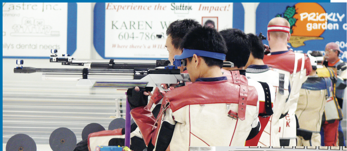
來福槍型氣步槍比賽昨日上午在列治文舉行，來自台灣的6名選手共奪得包括團體冠軍在內的4面金牌，大獲全勝。圖為選手們在比賽。