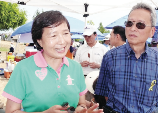
前台灣總統府秘書長葉菊蘭正在本地進行私人訪問，昨日也現身園遊會，並稱為民進黨執政期間的自由民主成就感到自豪。

由大溫哥華台灣同鄉會主辦的台灣日園遊會，可說是本地台灣僑界最大的活動之一，從1994年開始每年一次，為遠離家鄉的鄉親們提供品嚐地道家鄉美食的機會，也讓大溫民眾分