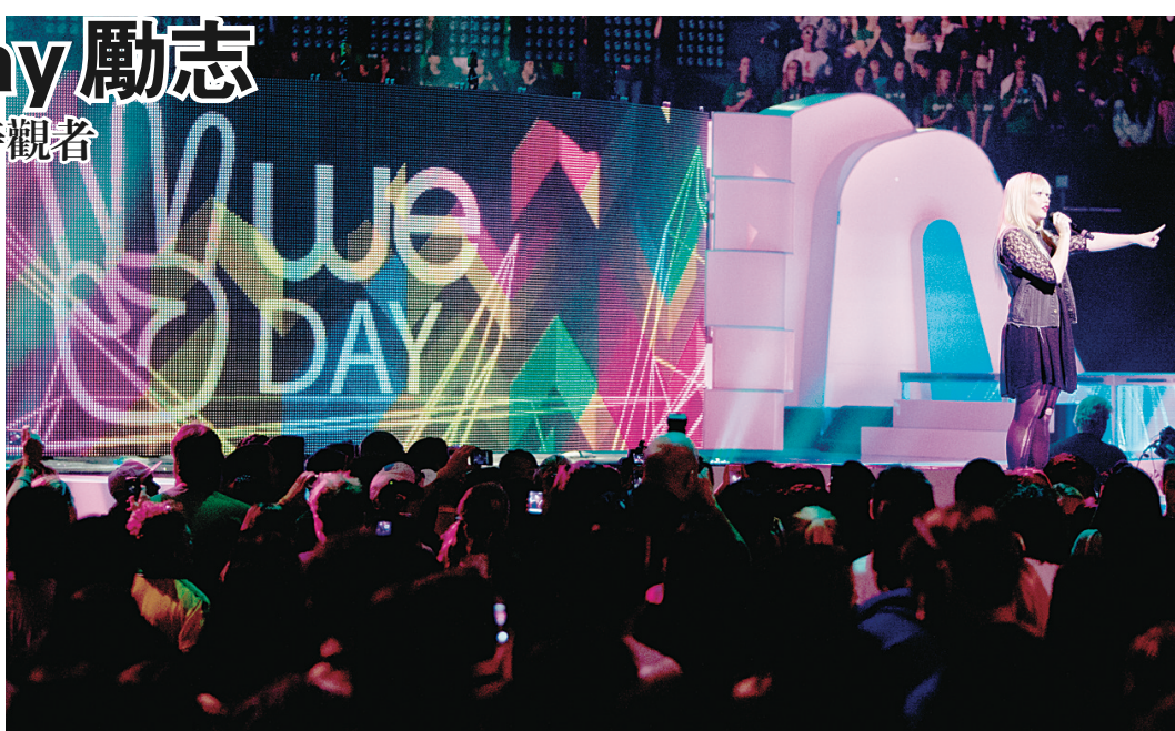
X Factor 的評審 Demi Lovato 應邀在 We Day 表演。溫哥華 We Day 活動總共有約2萬名青少年參加。