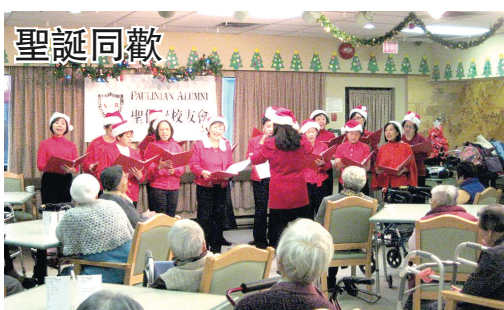
聖誕同歡 聖保祿校友今年已是第十年在聖誕節期間到訪安老院。該校校友們日前前往天恩、李國賢及華宮安老院，頌唱聖誕歌，派送禮物給長者，更與眾人齊玩遊戲，讓他們感受到社會的關懷，度過一個快樂的聖誕節。