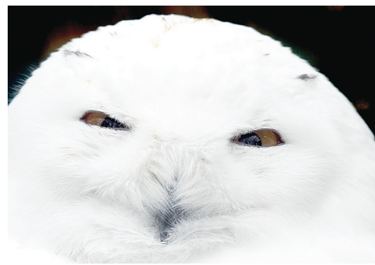
助養貓頭鷹是份不錯的聖誕禮物。