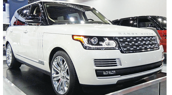
▲逾20萬的 Range Rover Autobiography Black，已在大溫賣出兩輛。