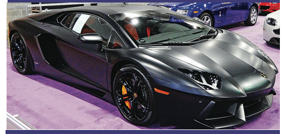
▲其中一款超跑辣車。