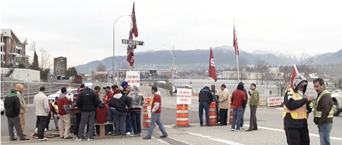
▲由於政府與司機各不讓步，溫哥華港口繼續癱瘓。 ▲聯邦運輸部長雷特認為 14 點建議足可解決問題。

雷特昨日拒絕電話訪問，而其部門的發言人於電郵中回應，貨櫃車司機問題是屬省府管轄範圍，非由聯邦規管。