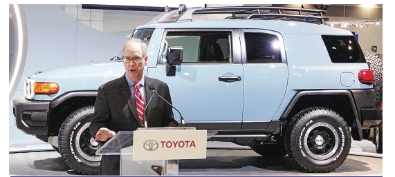
▲比提介紹限量版的 FJ Cruiser 四驅車。

溫哥華國際車展位於溫哥華會展中心，展期至本週日 (30日)。市民如欲了解詳情，可上車展網站 vancouverinternationalautoshow.com 查詢。