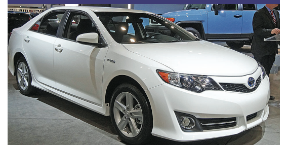
▲限量500輛的特別版油電混能 Camry。