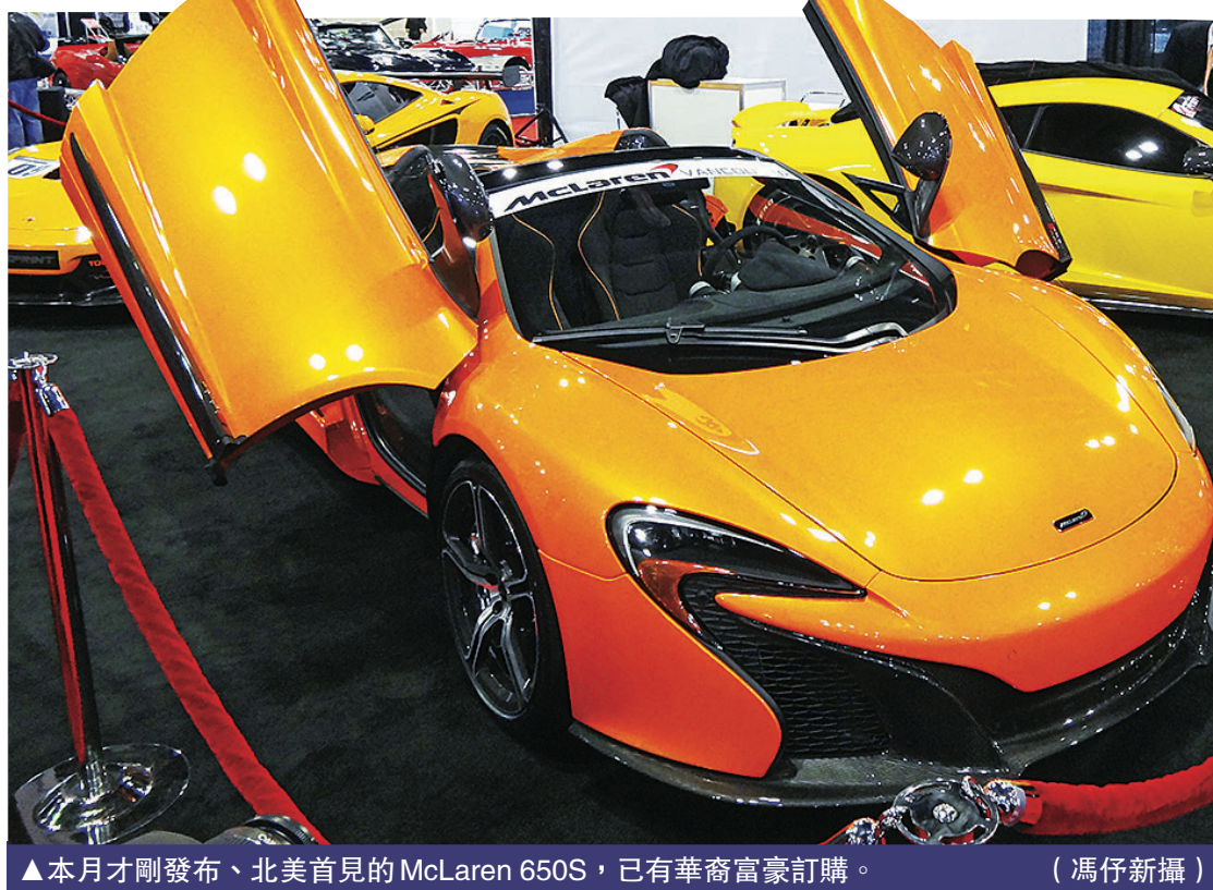
▲本月初才發布、北美首見的 McLaren 650S，已有華裔富豪訂購。

達菲爾德透露，雖然聯邦政府取消投資移民，外界認為可能會衝擊本地豪華車市場，但事實上買氣仍然強勁，並沒有感覺影響到生意。他稱這款 Range Rover Autobiography Black 全加拿大僅有20輛，目前已經賣出6輛，其中2輛便是在溫哥華賣出。而這並不代表大溫佔全國三分之一的市場，而是溫哥華只拿到2輛的配額。以他手上的輪候名單，倘6輛全部在溫哥華出售也絕無問題。