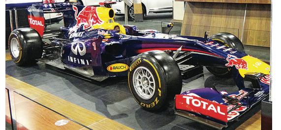
▲現場還有 F1 賽車。