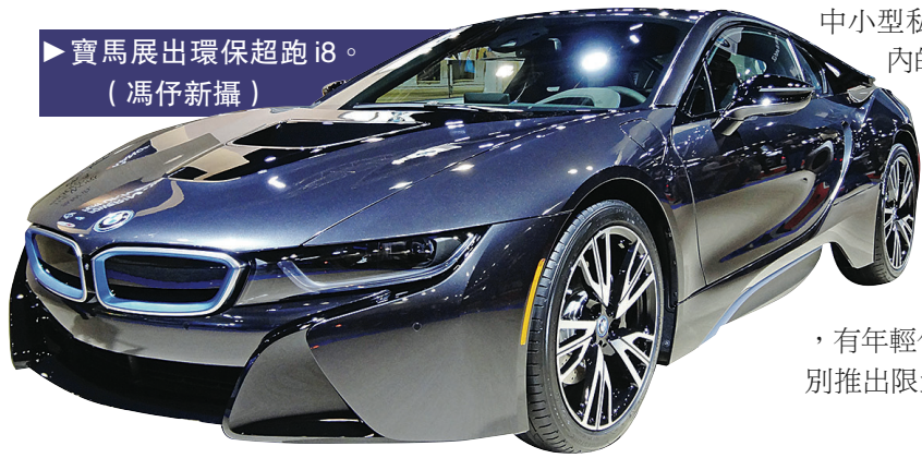
寶馬展出環保超跑 i8。

加拿大捷豹路虎 (Jaguar Land Rover) 總裁達菲爾德 (Lindsay Duffield)，昨日也為價格逾20萬元的頂級 Range Rover Autobiography Black 揭幕，該車首次在加拿大亮相。他不諱言大溫地區對豪華汽車的消費力非常可觀，去年路虎三分之一的加國銷售在大溫地區。而最主要的利治文經銷商，其中70%是以華人為主的亞裔買家。