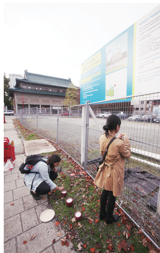
▲「憑弔」人士通過插香與綁繫黃絲帶，表達對華埠「過度」開發的疑慮。