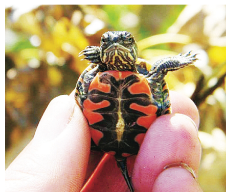
西部錦龜。(海岸西部錦龜項目)

錦龜可在凍僵情況下，經解凍而復蘇，基因非常特別，且非常長壽，在生命較後期仍具生育能力。牠們的壽命一般超過40年，雌性體長25厘米，雄性體長17厘米。