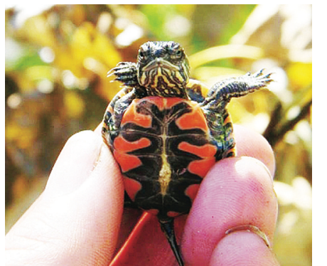
西部錦龜。(海岸西部錦龜項目)

錦龜可在凍僵情況下，經解凍而復蘇，基因非常特別，且非常長壽，在生命較後期仍具生育能力。牠們的壽命一般超過40年，雌性體長25厘米，雄性體長17厘米。