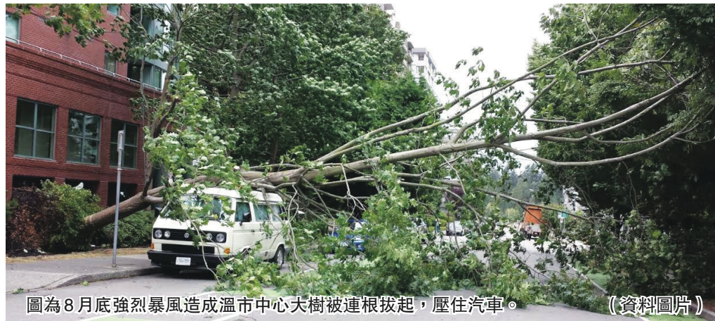
圖為8月底強烈暴風造成溫市中心大樹被連根拔起，壓住汽車。(資料圖片)

民眾可到 www2.gov.bc.ca/gov/content/safety/emergency-preparedness-response-recovery/preparedbc/know-the-risks/floods ，網頁右旁有中文資料下載的連結。