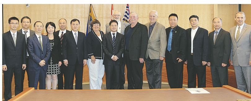
貴陽市政府代表團參觀本那比市政府。