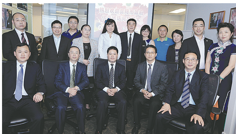
貴陽市政府代表團到訪溫市，在座談會後合照。