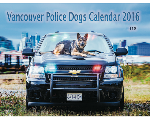
警犬接觸。市民也能在卑詩癌症基金會、卑詩兒童醫院基金會、溫市警局、溫哥華社區警務中心等地方購得月曆。

這份售價10元的警犬月曆，所得善款將會捐給卑詩癌症基金會(BC Cancer Foundation)以及卑詩兒童醫院基金會(BC Children's Hospital Foundation)。溫市警未來數周將會舉行路邊銷售活動，讓市民近距離與月曆上的「明星」