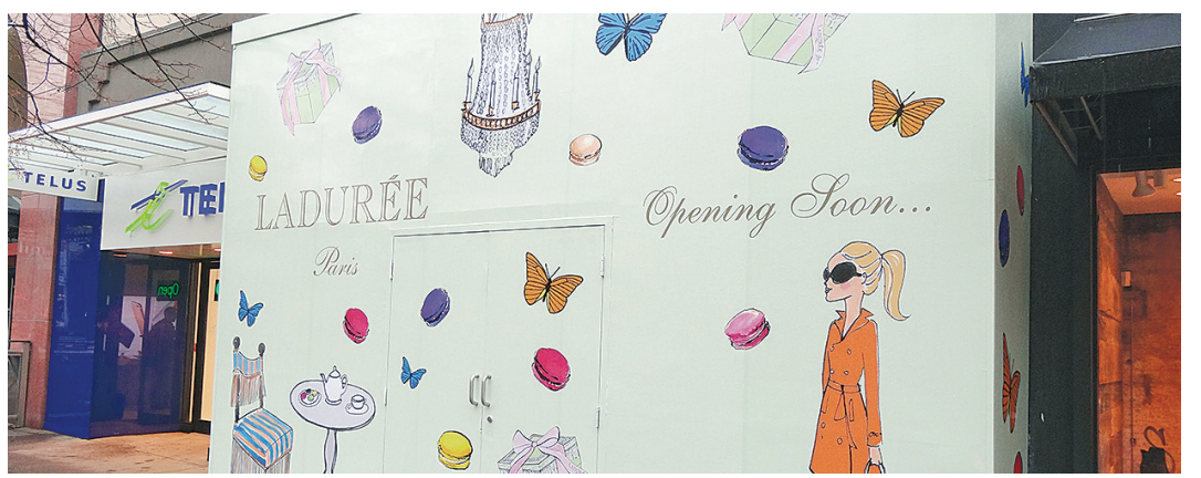
Ladurée 位於溫市中心的精品下午茶餐廳將於明年初開幕，目前外牆已經畫上品牌商標。