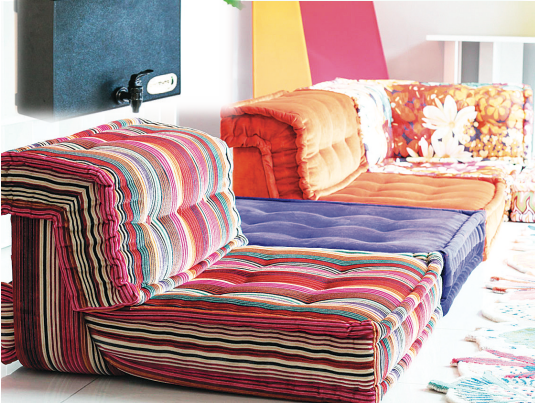
▼圖為「組合式沙發」的創意計劃，同樣晉身最後六強。