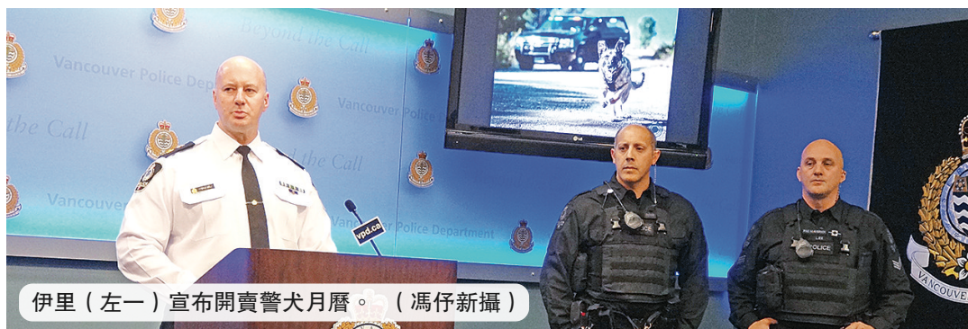
伊里(左一)宣布開賣警犬月曆。