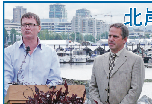
馮宜幹宣布省府將再為北岸步行及單車徑增撥100萬元款項，興建跨越加拿大鐵路的天橋；昨日將100萬元支票轉交北溫市長馬斯錫圖（右）。

【明報專訊】省運輸及基建廳長馮宜幹（Kevin Falcon）昨日代表省府宣布，為橫貫北岸的「北岸步行及單車徑」（North Shore Spirit Trail）項目，增撥100萬元，用於興建一座橫跨加拿大鐵路的天橋，方便民衆及單車人士。沿海岸從西端馬蹄灣（Horseshoe Bay）一直延伸至東端深灣（Deep Cove）的北岸步行及單車徑，總長度達35公里，由省府及北岸各市鎮政府合作興建，在增加了省府的撥款後，總預算達至450萬元。