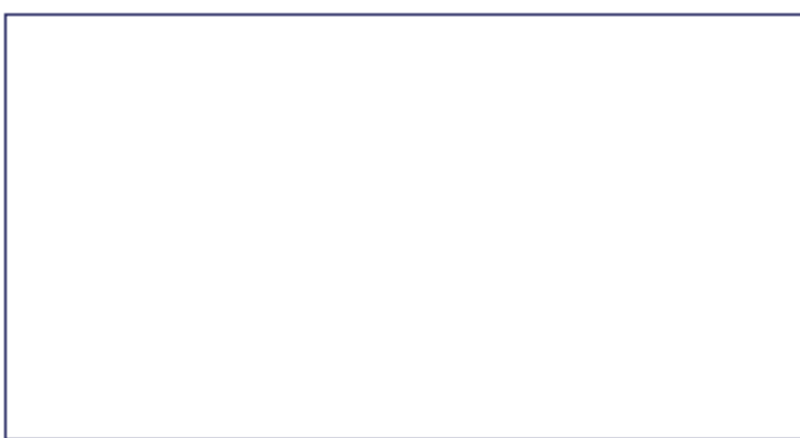
晚會中各長者與出席嘉賓合照。

卑詩移民服務會職業輔導組聯同大統華超級市場在今日上午九時卅分至十二時卅分，舉辦超級市場行業入門講座。屆時與會者除可以登記申請各類不同職位外，並有機會即場面試。職業輔導組亦提供免費國粵語個人就業輔導服務，內容包括就業培訓推薦、英語進修途徑、市場需求情況等。請在辦公時間致電六零四