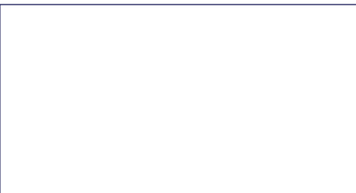
晚會中各長者與出席嘉賓合照。

職業輔導組亦提供免費國粵語個人就業輔導服務，內容包括就業培訓推薦、英語進修途徑、市場需求情況等。請在辦公時間致電六零四