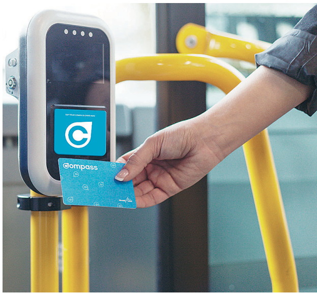
▲市民即日起可在售票機購買康百世卡及11月的月票。 ▼運聯近日在多個車站加派人手，專責協助顧客購買新款車票。

運聯並表示，顧客如使用康百世卡乘車，票價將會等同使用折扣優惠票(faresaver)。